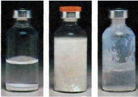
انسولین ان بی ای ، نه نشین شده